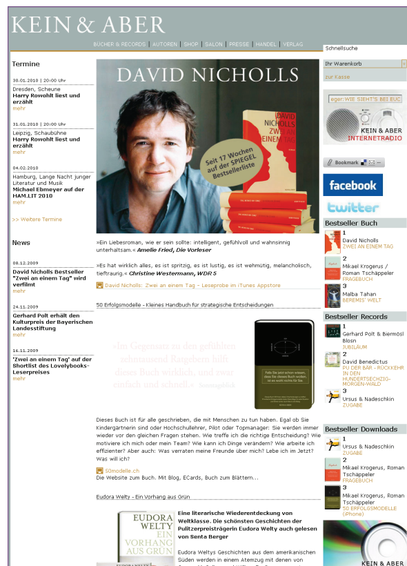
Startseite des neuen Webauftrittes