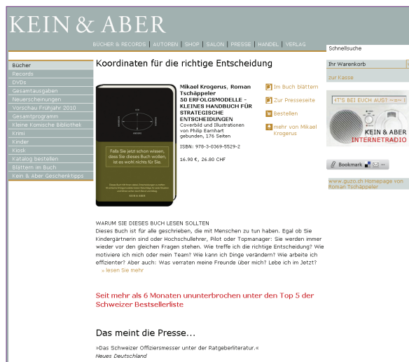
Detailseite eines Artikels im Shop

„Wir alle sind mit unseren neuen Internetauftritt sehr glücklich. Unser Partner Seitenbau hat alle unsere Vorstellungen eines modernen interaktiven Verlagsangebotes perfekt umgesetzt und den gesamten Webauftritt in wirklich kurzer Zeit realisiert. Ich bedanke mich für die tolle Zusammenarbeit.“